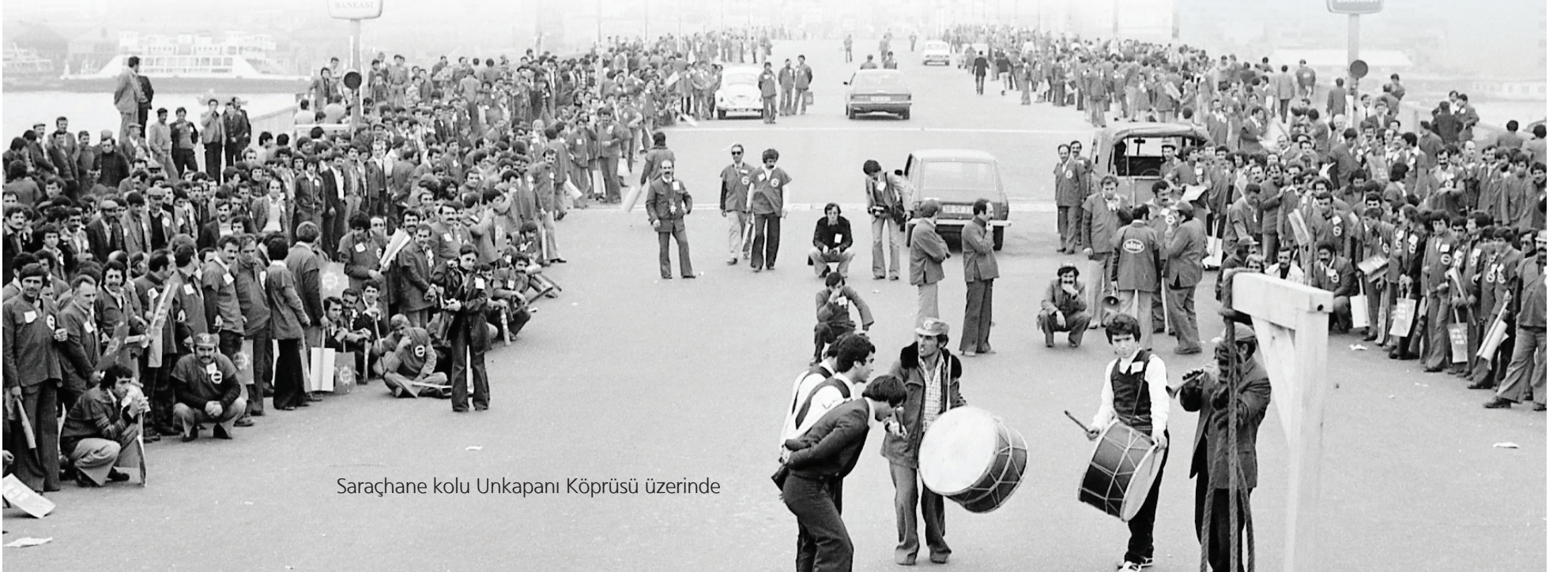
Sarıcahaneye kolu Unkapanı Köprüsü üzerinde