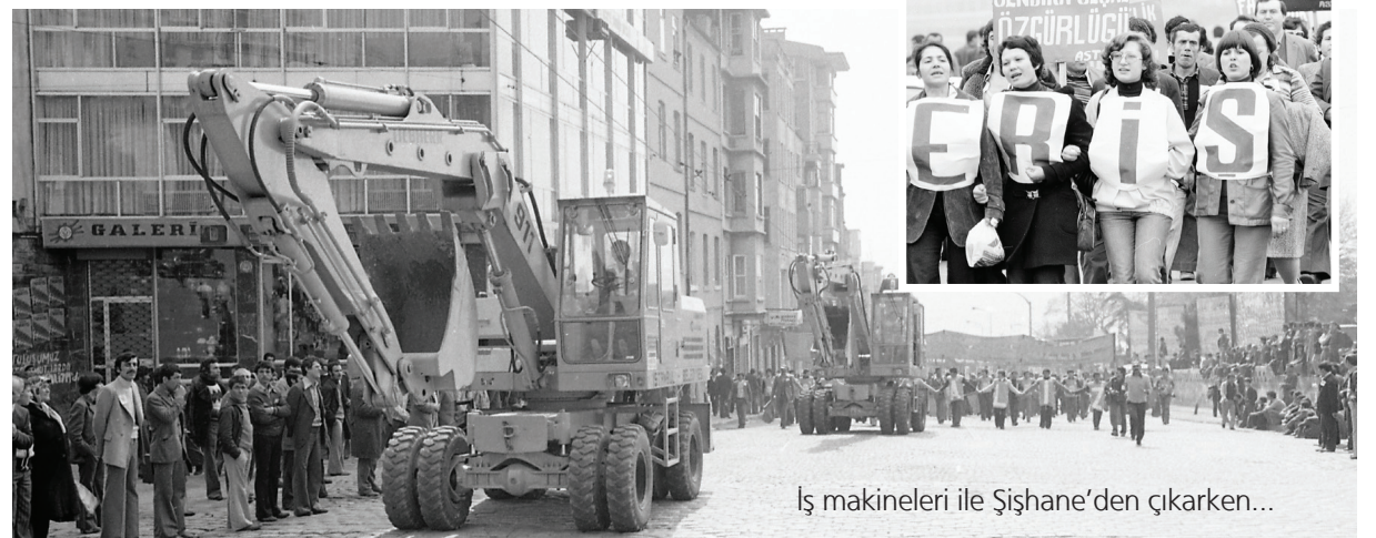
İş makineleri ile Şişhane'den çıkarken...