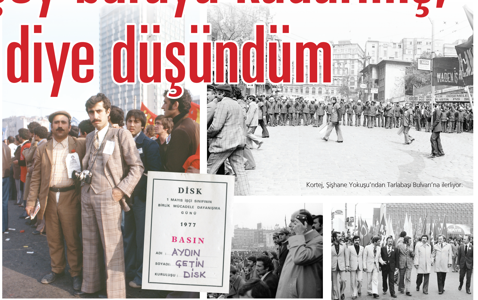
Kortej, Şişhane Yokuşu'ndan Tarlabası Bulvarı'na ilerliyor.