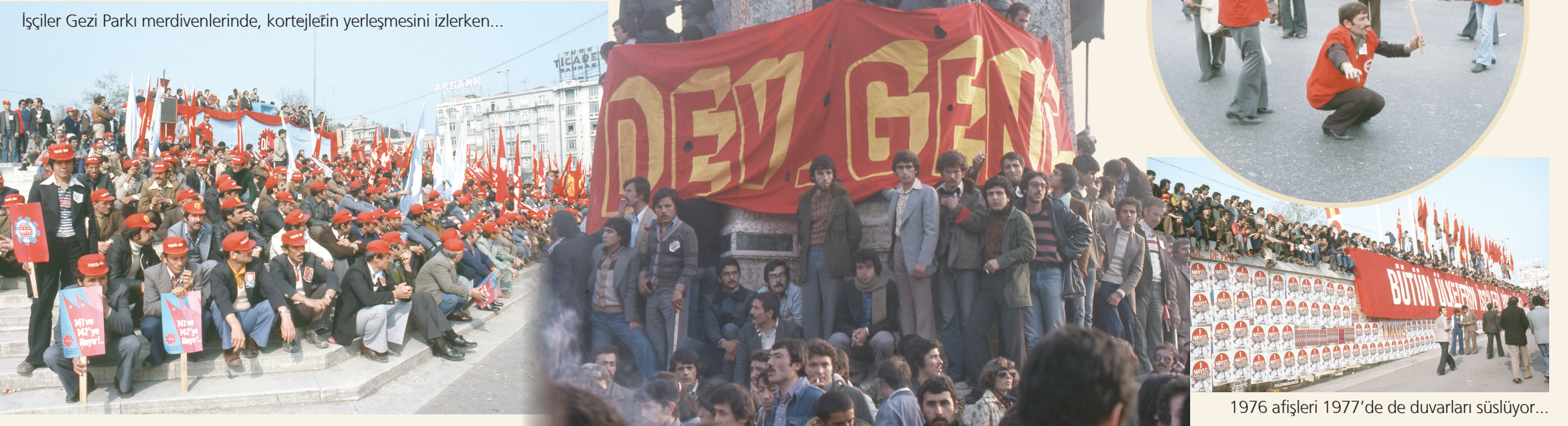
1976 afişleri 1977'de de duvarları süslüyor...