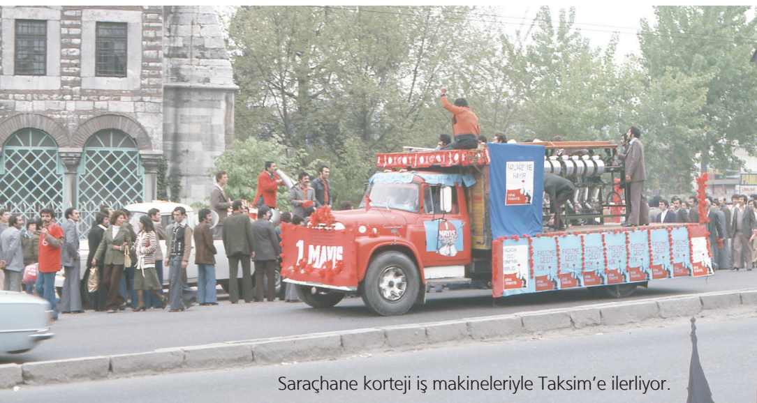
Saraçhane korteji iş makineleriyle Taksim'e ilerliyor.